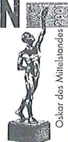
Oskar des Mittelstandes

Christian Bollin Armaturenfabrik GmbH - Westerbachstr. 290-294 - D-65936 Frankfurt/M.